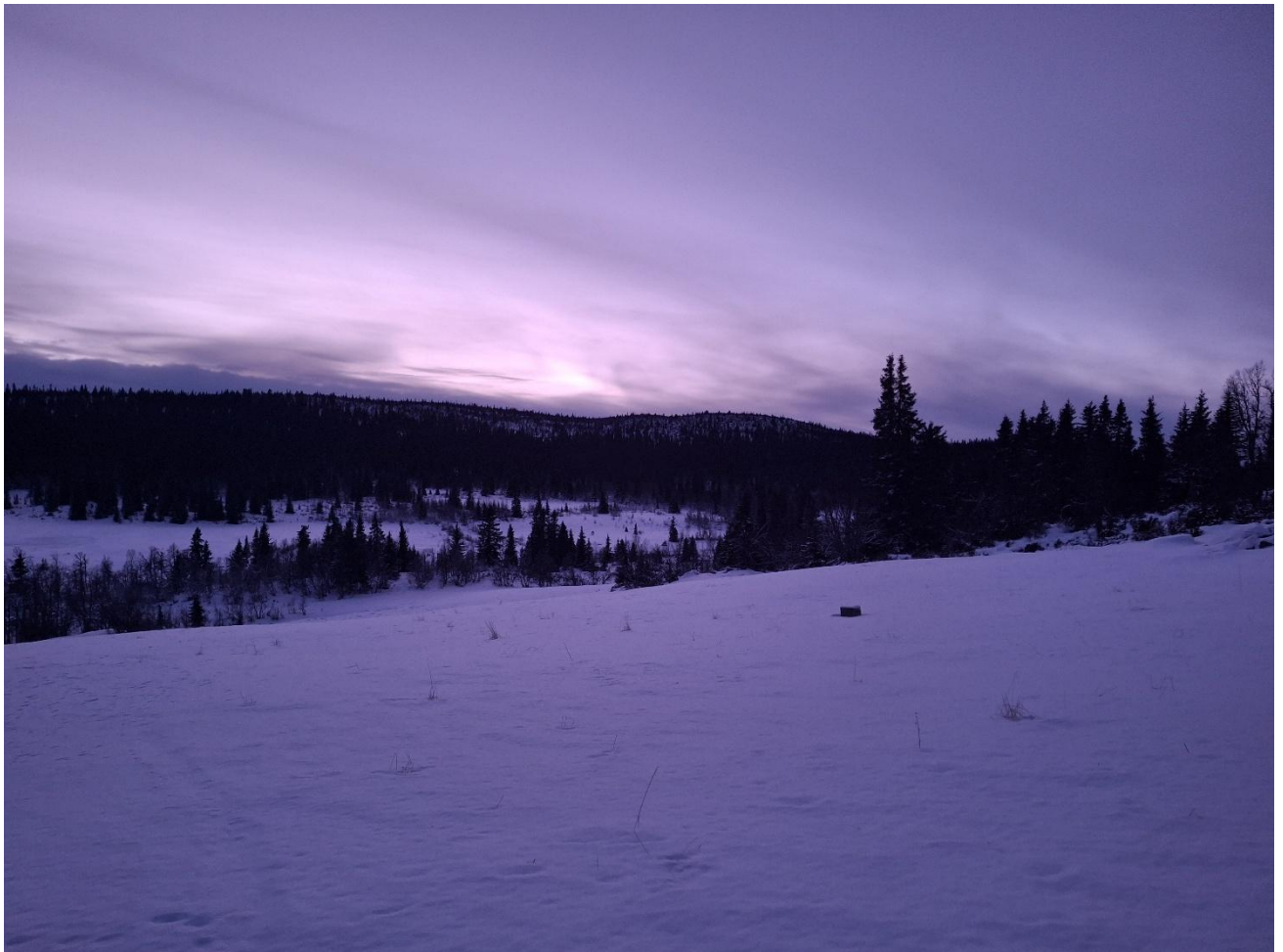
Eftasstemning ved Grava i januar 2025. Svært lite snø i fjellet.

Kjøregodtgjørelse etter statens satser for styret og bestyrer.