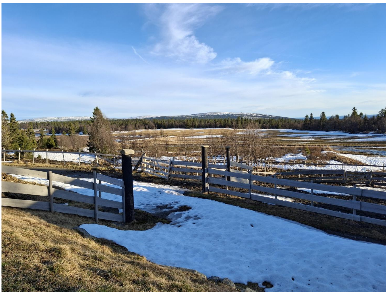
Fra Skålåsen den 19. april 2025.