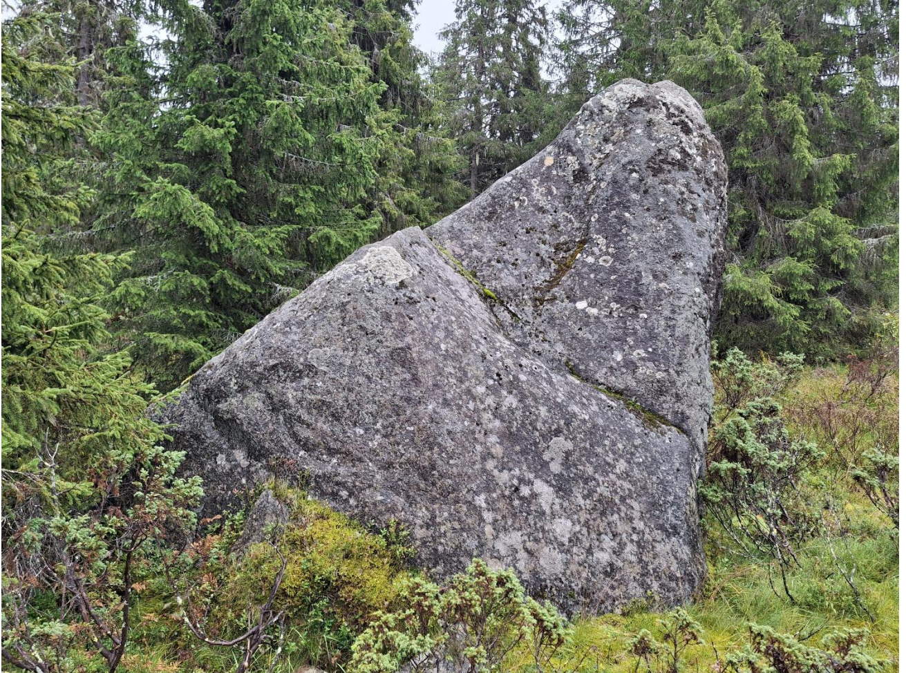
«Klukkstein». Fra vinterens driftsområde ved Ståkåmyrtjøynnet.

Ut over dette er det ingen ekstraordinære forhold som påvirker regnskapsresultatet, og regnskapet er avlagt under forutsetning av fortsatt drift.