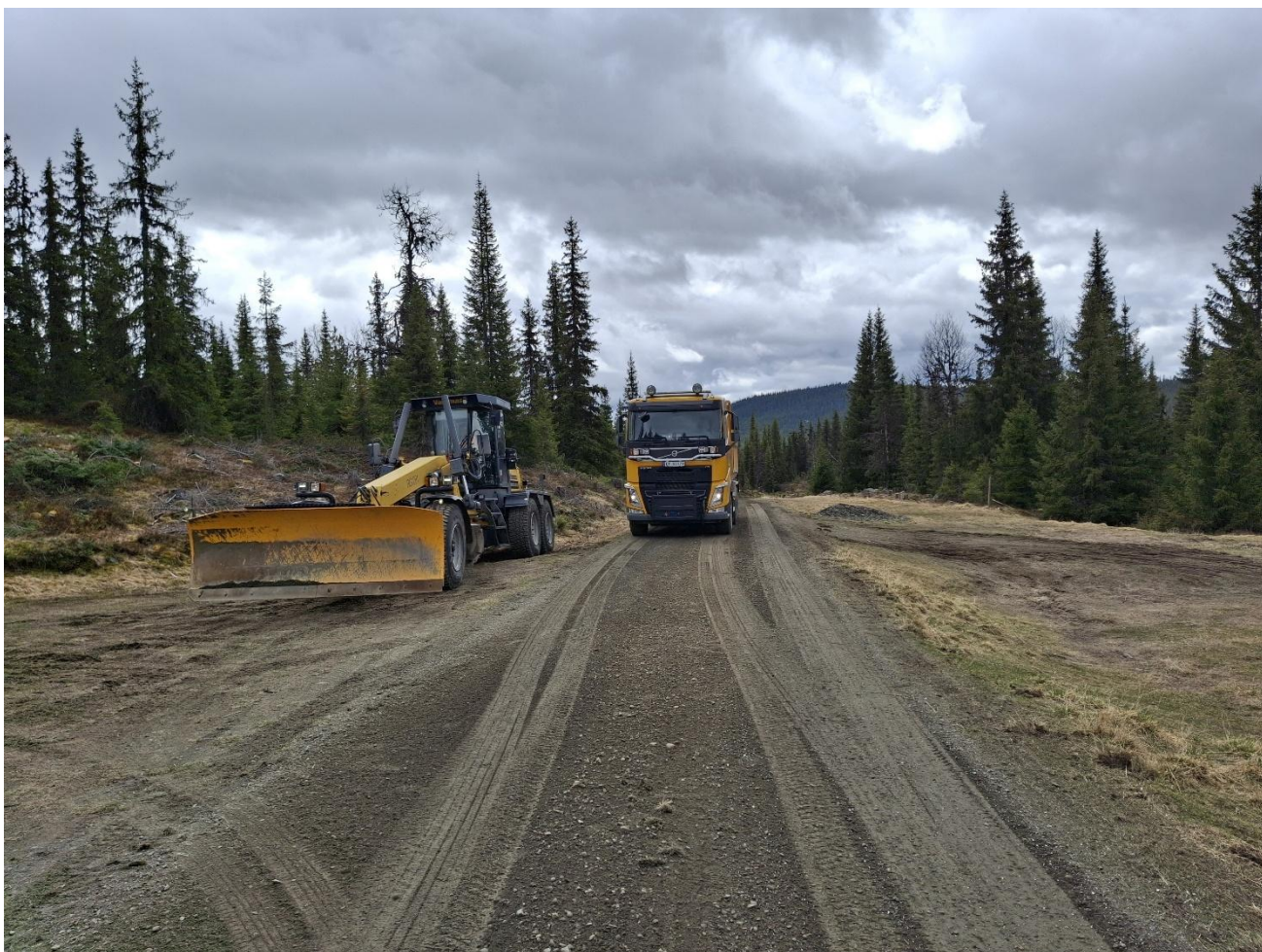
Vårvedlikehold i Åstdalen 9. mai 2026. Vegene åpnet 15. mai.

Almenningens virksomhet utøves i Øyer Statsalmenning. Statskog ivaretar grunneirollen som innebærer forvaltningen av alle grunndisponeringstiltak, mens bruksrett hjemlet i fjellova forvaltes av Øyer Fjellstyre. Fjellstyret blir orientert om planlagte foryngelseshogster i forkant og kan gi verdifulle innspill som supplement til de søk som blir foretatt i ulike arts – og miljødatabaser. All hogst er meldepliktig i forhold til vernskogbestemmelsene i skoglovgivningen.